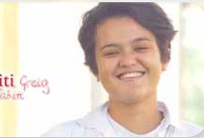
iti Greig Tahiti

UNE ANNÉE DE DISCERNEMENT SOUS LA MOUVANCE DE L'ESPRIT POUR FAIRE LA LUMIÈRE DANS TON CHOIX DE VIE