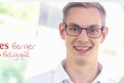
es Berger Belgique