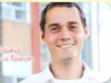
French Île de la Réunion