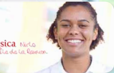
sica Nerlo Île de la Réunion