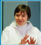
par Solène Garneau, fmj